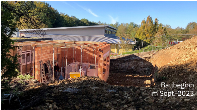
Baubeginn im Sept. 2023